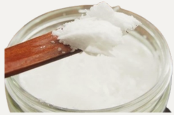
Crema di Cocco BIO

Il cocco in panetti è prodotto con noci di cocco mature certificate biologiche, che sono state sgusciate e decorticate manualmente. L'acqua viene drenata; La polpa viene lavata, pastorizzata, sminuzzata, asciugata e macinata fino ad ottenere una pasta densa.