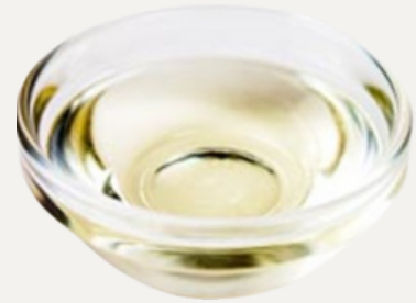
Olio di Cocco

Fatto esclusivamente dalla polpa della noce di cocco tramite pressione meccanica, seguito poi dall'estrazione dello stesso tramite esano. L'olio viene poi raffinato attraverso processi di de-acidificazione, raffinazione e deodorizzazione.