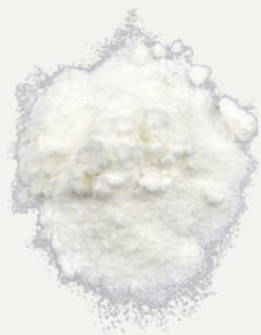
Latte di Cocco in Polvere

Imballaggio: 1 panetto da 20 kg avvolto da un film in polietilene azzurro di alta densità contenuto in un cartone.